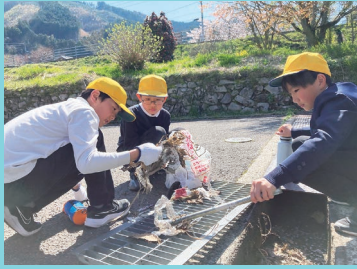
『ゴミ拾いを全力で!』

新メンバーを迎え入れた遊友団では今年から「毎週水曜日のミーティング」と「毎月1回ボランティア活動」