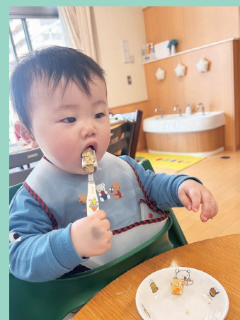
『大きなお口でバクリ』

時間に追われないランチルームでの食事、午睡ルームで落ち着いた睡眠…それらを通して、こどもたちは日々、のびのびとゆったりと1人1人