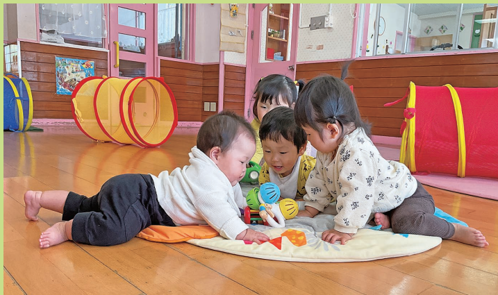
『ほほえみあいと耳と心を傾けて』