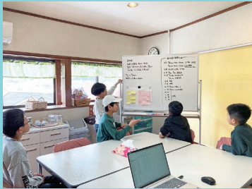
『定例ミーティング!』