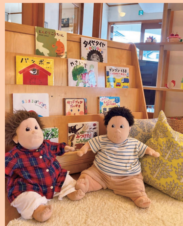
『ヤマシマに包まれて…』