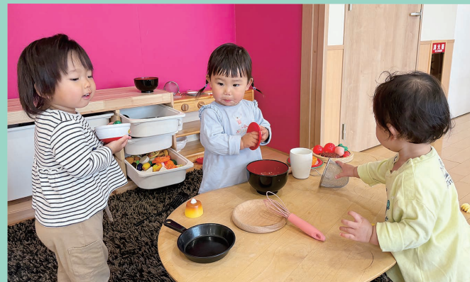
『会話が聞こえてきそうです』