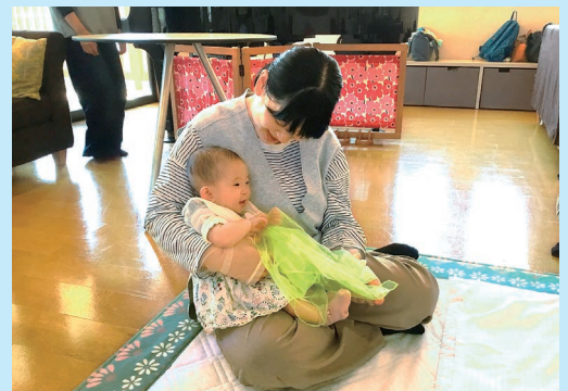
『抱っこでゆーらゆーら』