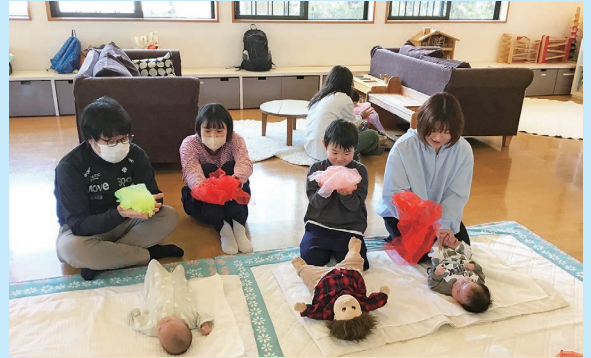
『わらべうたで遊ぼう』