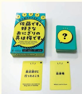
『何のカードが出るかな?』

子育て中の親子さんや地域の方が集う交流の場「Happy カフェ」今回はトークカードを使って、皆でお喋りを楽しみました。日頃、顔を合わせていても、意外と知らない一面があるものです。自分を知ってもらい、相手に興味を持つことで、自然と会話も弾みます。トークを通じた交流で、より深い繋がりの時間となりました。