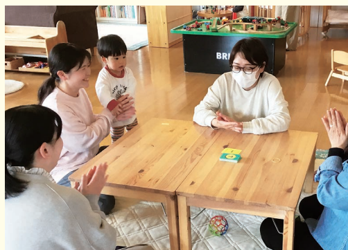
『お互いの新しい一面を知ることができました』