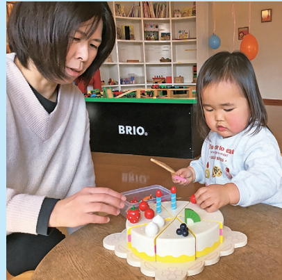
『ケーキをつくりましょう』