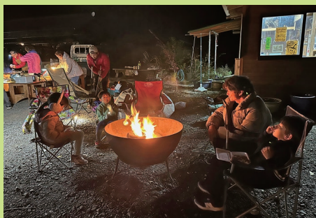
『焚火は癒されます』

昨年度、4月の第1回父母の会で「おやじの会」を発足させたい意向を伝え、賛同して下さる保護者と、若い男性スタッフとで会を立