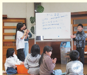
遊友団 (ジュニアボランティアグループ)