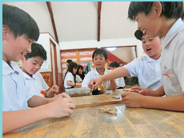
『将棋で盛り上がってます!!』

NIKO NIKO館は、毎週水・木・土曜日の開館日を「一般来館日」と呼んでいます。一般来館日とは、 申込み不要で、開館時間ならいつでも自由に遊びに来て もいい日のことです。『春の陽気に誘われて…』