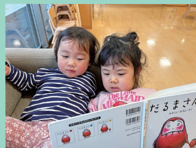
『のんびりソファで!!』