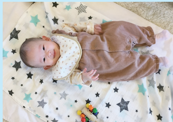
『笑顔に癒されます』

暖かくなり赤ちゃん連れの親子さんの来館も増えてきました。来館された親子さんは、お子さんの気に入った玩具と一緒に遊んだり、スタッフやお母さん同士でおしゃべりしたり