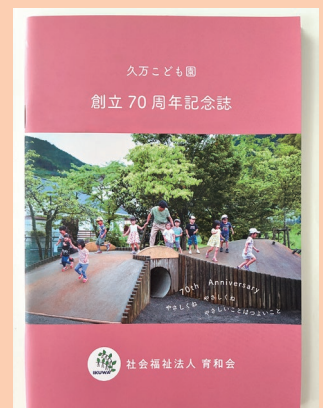
『久万こども園創立70周年記念誌』