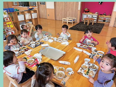
『みんなで楽しくランチ』