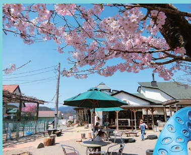
『春の陽気に誘われて…』

それぞれの曜日で、「お楽しみのひ・み・つ」がNIKO NIKO館に隠れています!!