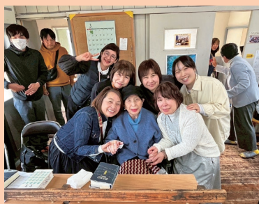
『歴史の始まりの場所 久万キリスト教会にて』