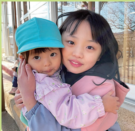
『お姉ちゃんとザッキー』

抱きしめること=ハグ」って、時間もお金もかからないけれど、愛情が伝わる効果は抜群の方法です。