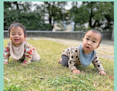
『お外気持ちいいね』

このように、マイナスと思われることも、足を伸ばせばプラスに変わることがあります。子どもたちが過ごす地域の良さを生かしながら、一緒に楽しんでいきたいと思えます。