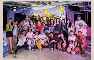
『Happy new year!!』