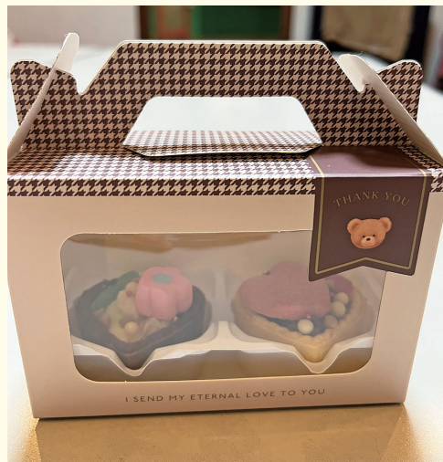
『昨年のバレンタインチョコレート』