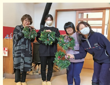
『出会い、繋がりの中 Happyカフェ』 『素敵なおリースの完成』