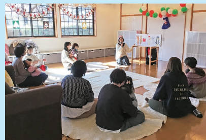
『絵本の読み聞かせ』