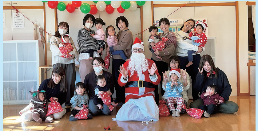
『サンタマンと記念撮影』