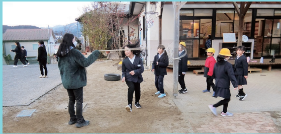
『昔から変わらぬ光景』

寒い日が続いていますが、子ども達は元気いっぱい。宿題が終わると外へとびだしていきま。ドッジボールやバスケットボールを楽しむ 『日々練習!!』