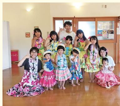
『可愛いフラガール』