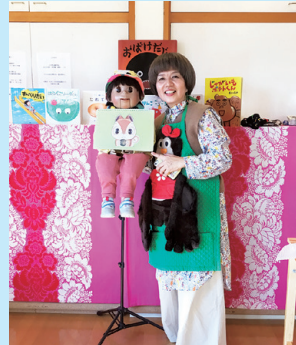
『えっちゃんどぐりちゃん』