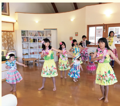
『フラダンスって楽しいね』

可愛い衣装で気分上々、曲に合わせリズムカルに踊ります。「初めての体験で、小学生の踊りに感動しました。」「フラダンスが気に入って、帰宅してからも曲を探し、姉弟ですって踊っていました」。と、嬉しい声が届きました。