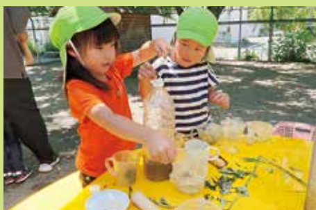
『友だちと一緒にの道具を使ってジュースを作るよ!』