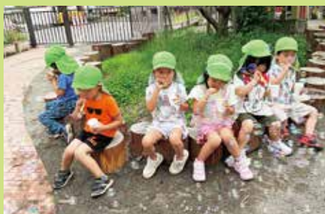
『みんなであそぶと楽しいね♪』