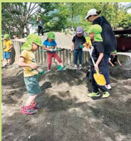
『協力して大きな山作り!!』