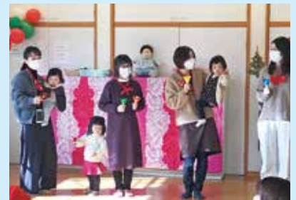
『クリスマス会での演奏』