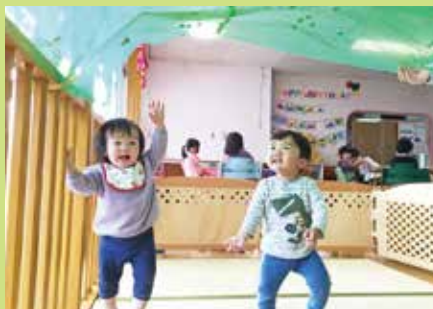
『一緒に遊ぶの楽しいね』