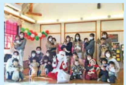
『つよいの広場さんと合同クリスマス会』