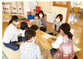
『気楽に語り合うおしゃべりの会』