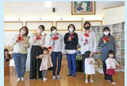
『20周年記念式に向けて』