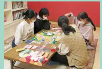
『久しぶりの人生ゲーム』