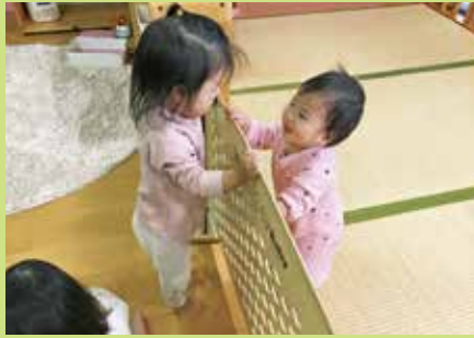
『いない! いはい! ばあ!』