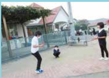
『友ガチと競い合うことで上達します』

も連続で跳んだり、3重跳びやメドレーといった難しい跳び方に挑戦したりする児童もいます。スタッフの目から見ると十分縄跳び名人なのですが、学校からもらっている縄跳び検定表ではまだまだなのだから。一つでも