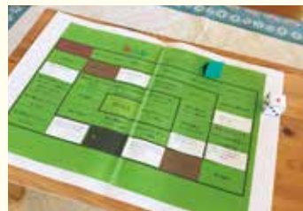
『ゲーム感覚のすごろくトーク』