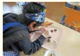
『一生懸命作ってます』