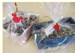
『ラッピングをして完成!!』