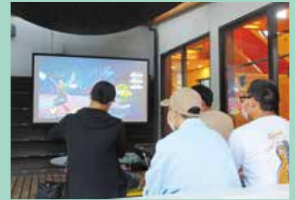
『スマブラ 最強決定戦!』