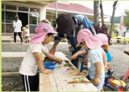
『ドキュメンテーションに発見や気づきを記録』

保育の中で、保育ドキュメンテーション(写真付きエピソード記録)が注目されています。子どもの姿を振り返り、対話し、味わい、保育の質を高めていく道具。その対話とは、自分、同僚、こども、保護者との対話のことだそう。これをやるようになり、子どもの話に耳を傾けることが増えました。子どもの気持ちを先取りすることなく、子ども自身が感じたことに共感することができます。自分で気づき、考えることができるように待つことで、自らのびのびと育つ力が育っているように感じました。そして、驚きや気づきをシェアすることで、その学びがみんなへと広がっていき、子どもの魅力をより感じられるようになりました。みんなで幸せな保育・子育てができるように続けていきたいと思っています。