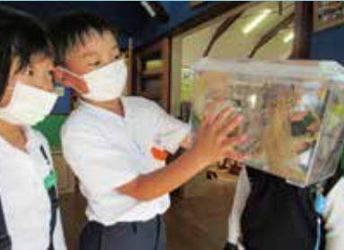
『あっ!エサ食べてるよ』

と言うと、「魚の動きを観察中』『そうか!』と納得した様子でした。普段自分達が食べるものも調理されていて、命を頂いて生きているということを忘れてしまいそうになりますが、生き物の観察や飼育を通して伝えていくことが大切だなと思いました。