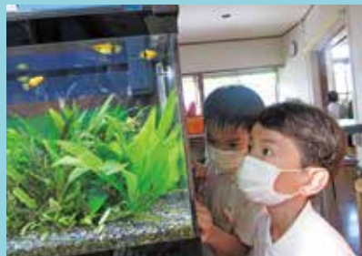
『魚の動きを観察中』