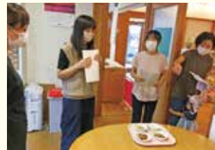
『実際に1~2歳児ランチを見ながら』