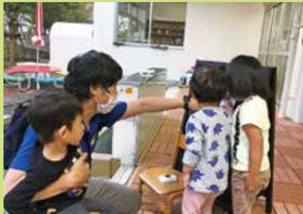
『降園時に今日の出来事を保護者に向けて掲示』