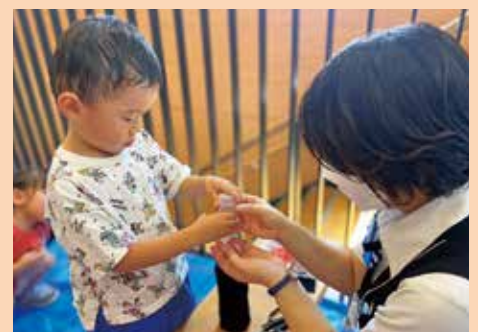
『美味しいイチゴはかられ』