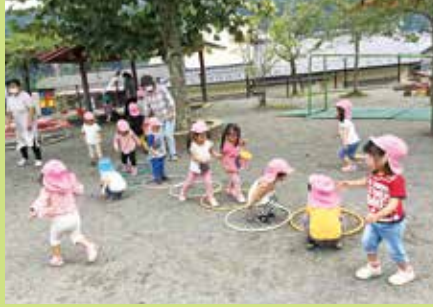
『子どもの面白い遊びや成長を記録』