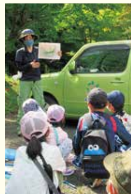
『講師りょうちゃんの話聞いてます』