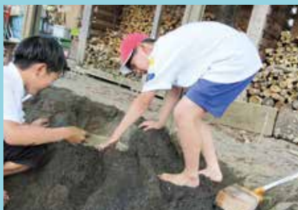
『落とし穴に気を付けて!』