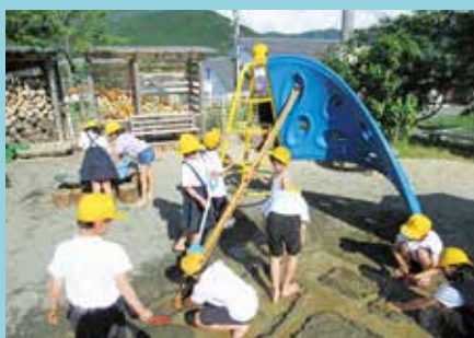
『力を合わせて作ろう』