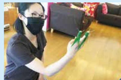
『ママの葉のバツガができました』