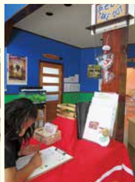
『あそびのTAKEOUTコーナー』