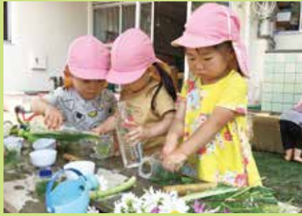
『みんな色に変わるのかな?』

園庭をあちこち歩いて「いいものさがし」をして遊ぶ子ども達。色々な物に興味をもち、見て触れて楽しんでます。遊びから「やりたいな」「おもしろいな」という思いが生まれ、心を動かされる経験をします。プランターの花を「きれいね、ピンクがいい。」と摘んで花瓶に挿してみたり、アリやダンゴムシをバケツに入れ持ち歩いたりするうちに、命があることを知ります。しゃがんだ姿勢の泥んこ遊び、凸凹を歩いたりスコップやバケツを使ったりする砂場遊び、草花で作る色水遊び、これらには小さな子ども達に経験してほしい要素がいっぱいです。何度も見て