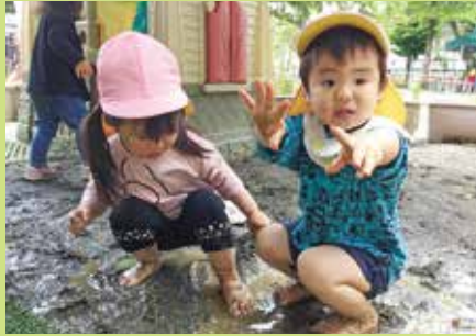
『泥んこ遊びがーい好き』