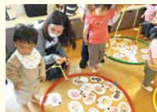
『どんな食べ物釣ろうかな?』