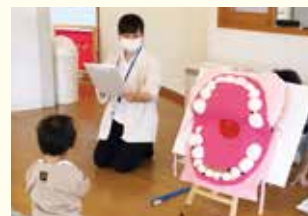
『大きなお口であーん』