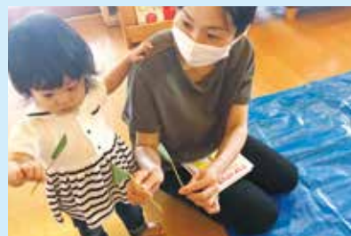
『ペロペロキャンディの出来上がり!!』