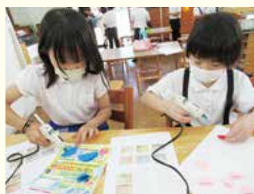
『これってどうするんだっけ?』

おうち時間に小物やおもちゃを手作りしませんか? NIKO NIKO 館では、子ども達が家で手軽に工作や手芸、実験などを楽しめるよう、「あそびのテイクアウト」をご用意しています。中には作り方の説明書と材料が入っています。初めての人も、前に利用したことがある人も季節ごとに新作をそろえていますので、ぜひチェックしてみてください♪