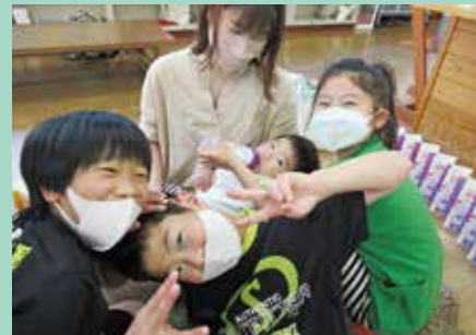
『ミルク飲んでるね』