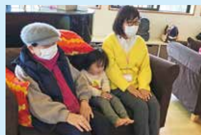
『ボクもいっしょに!』