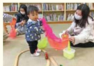
『柳谷地区 ひっばって!何ができるかな?』