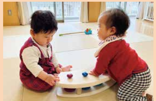
『ねえ、一緒に遊ぼうよー!!』