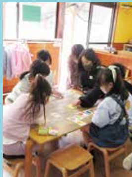
『学年に関係なくみんなでき仲良く』

4月に新しいメンバーが 加わり、ひとり一人が 気持ちを新たにして始 まった新年度のNIKO NIKOクラブ。久万、 明神、畑野川、直瀬、 仕七川小学校の5校の 児童が利用しています。