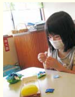
『こっとなコットン』