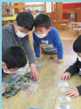
『ねえ、どうやって遊ぶの?』

今年の新1年生は、女 子児童が多く、お人形 遊びやままごとなどの ごっこ遊び、一輪車の 練習をする姿が多く見 られています。上級生 たちが、手本を見せな がら新1年生にクラブ のルールを教えてくれ たり、遊びをリードし