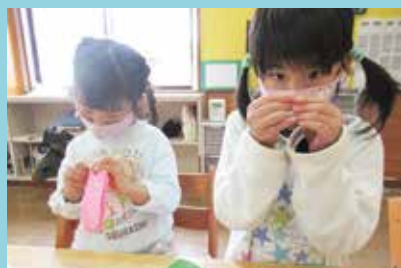
『初めての体験…真剣です』

て、一緒に 過ごすこと ができるの が、NIKO NIKOクラ ブの良さの ひとつです。