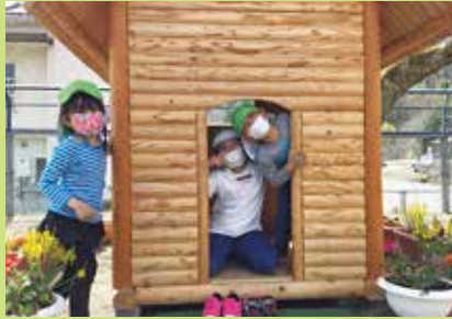
『ぼく、わたしのお家だよ』

2つ目は、主体性を大切に、子ども自身が考え、発見する場面をつくります。「きっかけ」→「疑問」→「理解」→「気づき」ステップごとに丁寧に取り組むことで、より深い理解に繋がります。