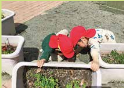
『何が隠れているのかな?』

2つ目は、主体性を大切に、子ども自身が考え、発見する場面をつくります。「きっかけ」→「疑問」→「理解」→「気づき」ステップごとに丁寧に取り組むことで、より深い理解に繋がります。