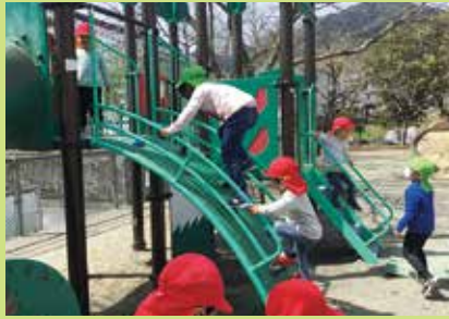
『大きな子をお手本に...』

久万こども園では、だれもが安心して笑顔でくらす社会を目指して、日常の保育の中で、子どもたちはSDGsの課題を考え、体験を通じ学んでいきます。