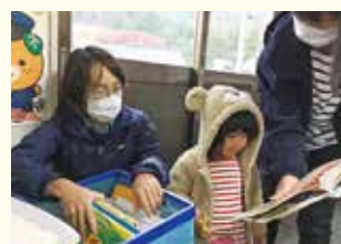
『仕七川地区 絵本はどれがいいかな?』