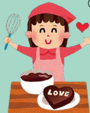
『バレンタインチョコ作り』