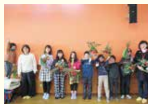
『お正月飾りの出来上がり!!』