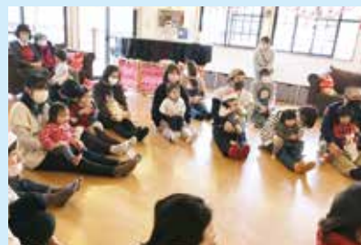
『みん茶でバスごっこ』