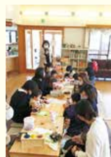
『昨年の子育てトークの様子』