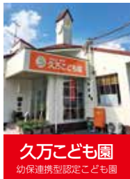
久万こども園 幼保連携型認定こども園

2歳からの友達の結婚式が2/14。その結婚式で、Perfumeの「チョココレートディスコ!」が流れていました。バレンタインの日は毎年、友達のこととその曲が頭の中ぐるぐる流れています。