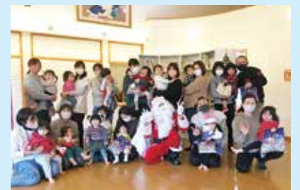
『つゆいの広場と合同クリスマス会』