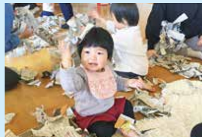
『新聞あそび、楽しい!!』