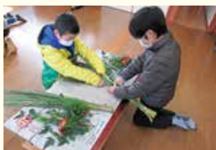
『三つ編みに編んでいます』

12月18日(土)花育キッズを開催しました。テーマはお正月飾り。まずはレモングラスを三つ編みにして土台を作りました。友達と2人で協力しながら作業をしました。次に杉やヒバ、ブルーアイスなどの枝をカットしながら東ね、最後に木の実やリボン、水引を飾りました。華やかなお正月にふさわしいアレンジメントが出来ました。