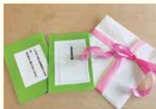
『スペシャルカードを用意して』