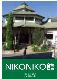
NIKONIKO 館 児童館

〒791-1201 愛媛県上浮穴郡 久万高原町久万1444-5 TEL:0892-21-3192 FAX:0892-21-3191 sien@ikuwa.or.jp