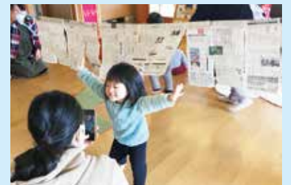
『新聞紙のトンネルから、ばあ』