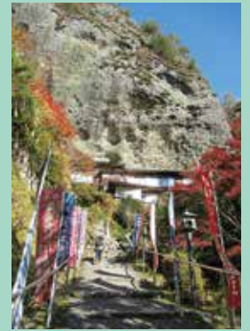
『岩屋寺を目指します』