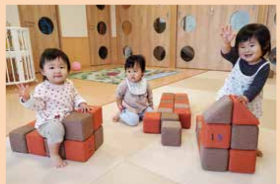
『みんなと遊ぶと楽しいね』