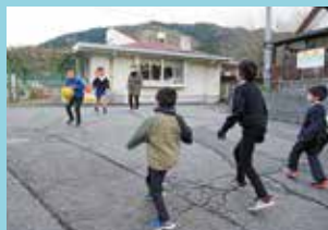
『チーム対抗!タッヂボール』