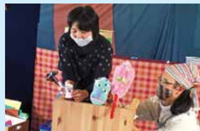
『出来上がった人形の紹介』