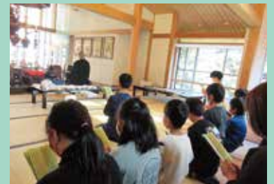
『お経を読んでいます』