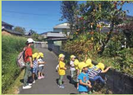
『カニマンは登れないね…』

四季に合わせた絵本の読み聞かせをすると、散歩に出かけた時、途中で見つけた柿の木の前で『さるかに合戦』を思い出して立ち止まったり、近年見ることが少なくなった稲刈りシーズンの“稲木”の風景を見て、「3匹のこぶたのワラのお家みたい!」と子ども達の声が。また、クリスマス会の劇に向けて絵本を読み聞かせた後日に、散歩で