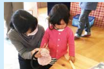
『おめめはどこにつけようか!?!』