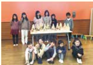
『個性溢れるツリーがたくまん!!』