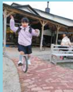
『みてみて!一輪車乗れるようになったよ!』