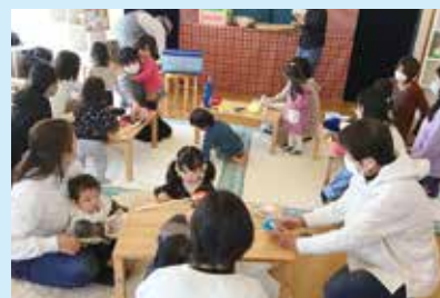
『ワークショップの様子』