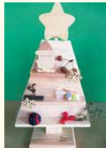
『クリスマスツリーの完成!!』