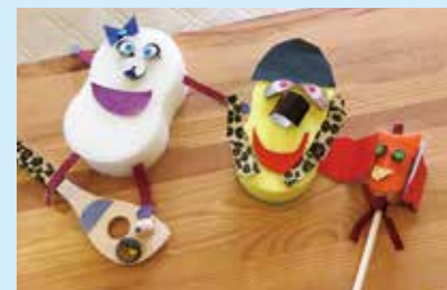
『個性的な作品ができました!』