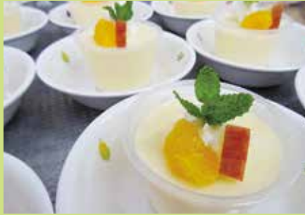
『レモンバームを添えました』