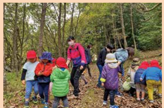
『通称:トトロの森 in 久万高原町』