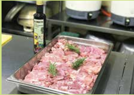
『オリーブオイル&ローズマリー』

“ハーブの魅力を、大人だけでなく幼い子どもたちにも伝えたい”と地域の方たちが園庭に数種類のハーブを植えて下さり、その思いに私たちも共感し、「香りの保育」がスタートしました。こども園の食事に世界の料理を取り入れるようになり、身近なハーブを食材として使う機会も増えてきています。イタリア料理にはオリーブオイルとローズマリーの香りを、プリン・ア・ラ・モードにはレモンバームを添えてみました。子どもたちは小さな葉っぱを手に、「これ食べれるん?」と興味津々。ちょっとだけかじってみて、「あ!これ、おかあさんのガムのおいがする!」と目を丸くする子もいます。