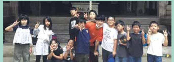
『達成感であふれた顔が勢ぞろい!』