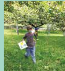
『なし園でのミッション』