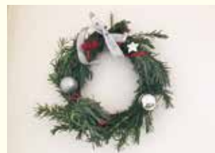
『ハーブのリース完成!!』