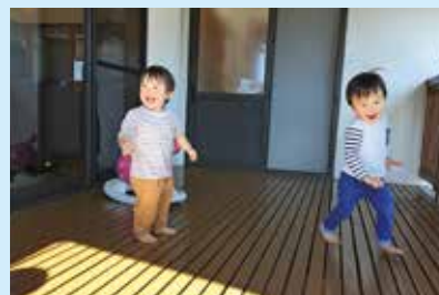
『ねえ、追いかっこしよう!』