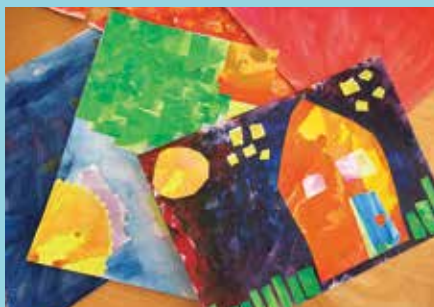
『個性的な作品の出来上がり』