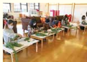
『オリジナルリース作り』