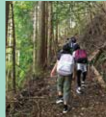
『険しい山道を歩いています』