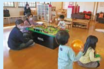
『土曜開館日の様子』