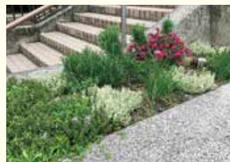
『ハーブの寄せ植え』