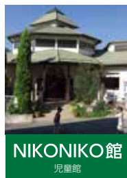
NIKONIKO 館 児童館

〒791-1201 愛媛県上浮穴郡 久万高原町久万1444-5 TEL:0892-21-3192 FAX:0892-21-3191 sien@ikuwa.or.jp