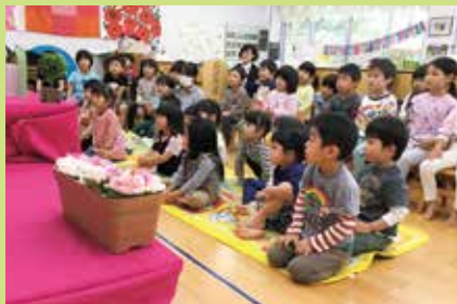
『何が始まるのかな』