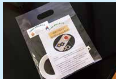
『「Happy おやこきつと」始めました』