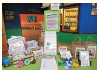
『あそびの TAKE OUT』