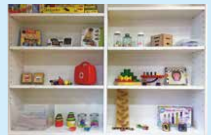
『おもちゃの貸し出しコーナーをリニューアル』