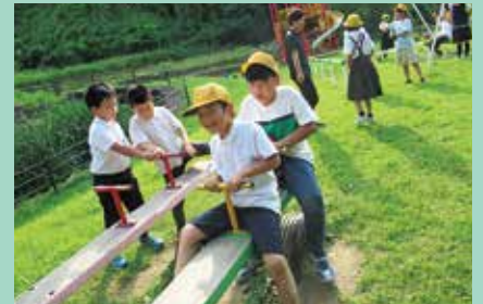
『シーソーで遊ぶぞー』

毎週水曜日は笛ヶ滝 day。NIKO NIKO 館から徒歩5分の笛ヶ滝公園に遊びに出かけます。滑り台、ブランコ、シーソーなどの大型遊具があり、思いっきり走り回れる原っぱがあるので笛ヶ滝 day を子どもたちは心待ちにしています。「鬼ごっこするひと」と掛け声がかかり、何人かが集まって鬼