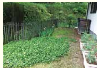
『シロツメクサと野菜』