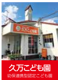
久万こども園 幼保連携型認定こども園

姪からあやとりの本を買ったので子どもたちと挑戦。意外に指が覚えていて、四段梯子もばっちり！昔もみんなでワイワイ遊んだなと懐かしい気持ちになりました。