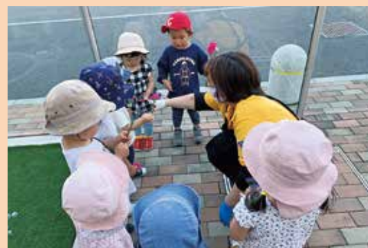
『このお花かわいいでしょ。』

おひさま園の子どもたちは、天気の良いときには施設周辺を散歩に出かけます。その中で、太陽市の花屋さんの前を通って花や野菜の苗を見たりすることもあります。「これなんの野菜ができる?」「ピンクのお花がいいな!」とかわい会話子どもたち同士ですっていると、JAの職員の方や地域の方に声をかけていただきます。開園当初、恥ずかしかった子どもたちも今では大きな声で挨拶をしたり、お花をいただくと時にはこれは何?と聞いてみたりしています。職員さんや地域の皆さんとのほんの少しの触れ合いですが、今後も大切にしていきたいです。