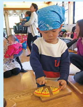
「ピザはいかがですか?」