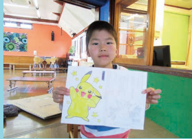
「ぬり絵がでかえよ」

新年度が始まりました。今年度もかわいい11名の一年生がNIKO NIKOクラブに入会してきました。男子4名、女子7名(久万小7名、畑野川小2名、仕七川小1名、柳谷小1名)で、圧倒的に女子が多くとても賑やかな、でも、しっかりとしていて落ち着いた子ども達です。少しずつクラブの生活にも慣れていろいろな遊びを満喫しています。一年生の好きな遊びを紹介します。