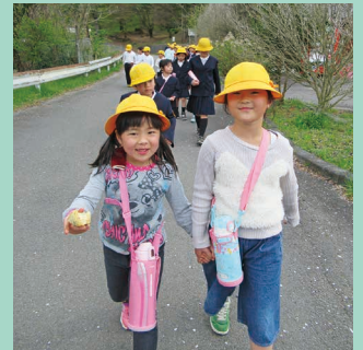
「今日は何しようかな?」