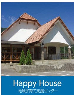
Happy House 地域子育て支援センター

〒791-1201 愛媛県上浮穴郡久万高原町久万 1447 TEL:0892-21-0777 FAX:0892-21-0772 hoiku@ikuwa.or.jp