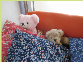
ぬいぐるみもペットとして使われており、とっても大切です。

こんな場面では、こう言う。こんな時には、こうする。このケーキは100円。などいろいろな事を自由に想像・表現し、〇〇ごっこの経験を通して、創造力や想像力が育まれています。子ども達のごっこ遊びの様子を観察していると、大人になりきって使う言葉や周りの大人の仕草、対応、使う道具などを細かく見ており観察力や記憶力に驚かされ、子ども達の成長を感じられます。