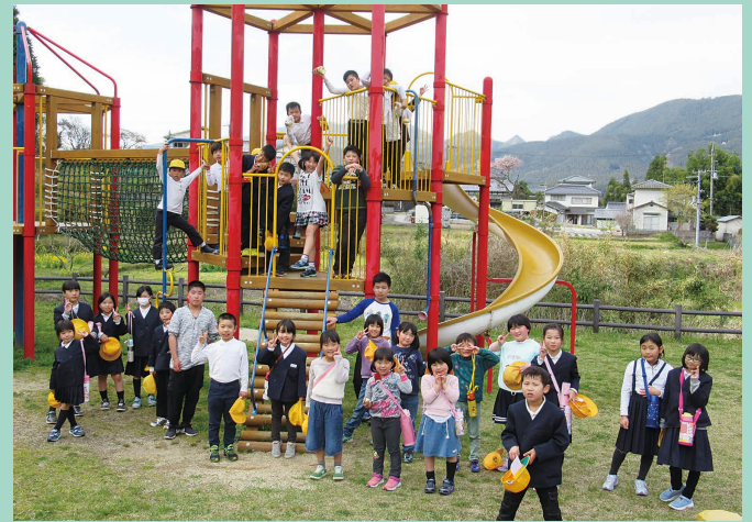
「みんなまで記念撮影」

毎週水曜日、天気がよい日に近くの公園で過ごします。広いグラウンドで、野球やサッカー、ボール遊びなどを思いっきり楽しんだり、自然の草花遊びや虫捕りに夢中になったり…。季節に応じて、子ども達それぞれが自分の好きなことを見つけて活動しています。異年齢で、学校が違う友達と、地域の人となど、普段とは違った交流も生まれ、子どもたちの表情は生き生きとしています。(児童厚生員 水谷 伴美)