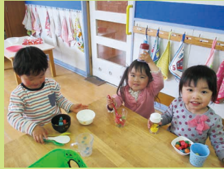
家族ごっこ「私がママよ～!! ご飯作るね」と会話が弾んでいます。

家族ごっこ・お店屋さんごっこ・医者さんごっこ・戦隊ヒーローごっこなど、子ども達が普段の生活で見たり、聞いたり、体験した中で、大人の職業を模倣して演じます。また、小石や木の棒など身近にある材料を使って「現実の道具」に見立てて、ごっこ遊びに用いています。