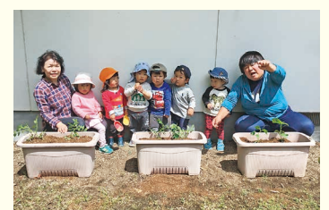
ミニトマトときゅうりの苗を植えました。早く大きくなるといいね♡