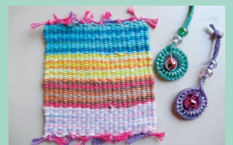
素敵に完成しました!