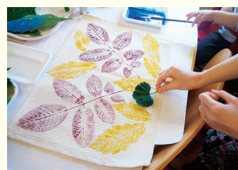
葉脈が生々しく出て素敵な作品に