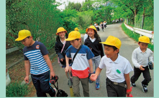
マァ…今日も野球楽しむぞ!!

活動を通して、他校同士の交流、異年齢交流、地域との交流、すべての児童がつながり、色々な経験をし、子どもたちは主体性を育てています。