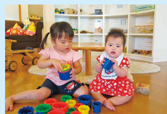
お姉ちゃん、あそぼ