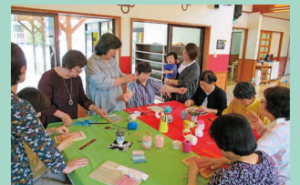
♪なカでも参加できます!