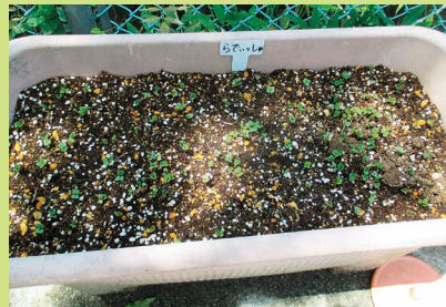
やっと芽がでてきて大喜び。