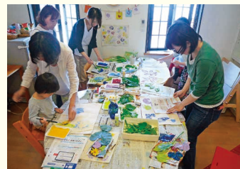
葉たぐを取ろう! 親子参加もありました。