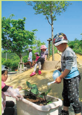
水やりも順番を守って上手です。