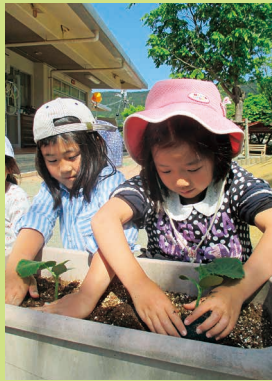
優しく土をかけてキュウリの苗を植えています。