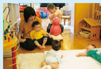
赤ちゃん、かわいいね♡