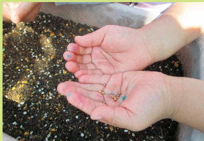
ラディッシュの種が小さくてビックリ