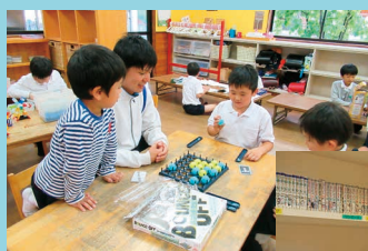
雨の日のテーブルゲーム