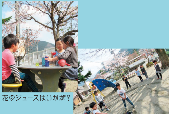
花のジュースはいかが?

ドッジボール、サッカー、おにごっこ。花の色水でジュースをつくり、どろ団子やどろんこケーキでレストラン。メニュー表を作る係、料理を作る係、接客係など、役割分担をしてお互いが得意なところを担当します。本当のレストランをお手本にリアルな表現や、おもてなしにも驚かされます。お会計の最後の決めゼリフは…。「ポイントカードお作りしますか…?」 (渡部 梨香)