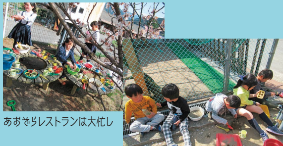
あおぎレストランは大忙し