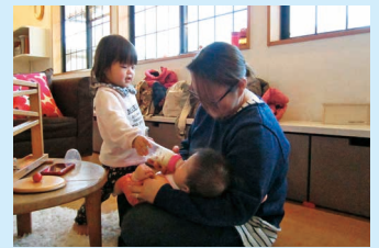
私もお手伝いする～