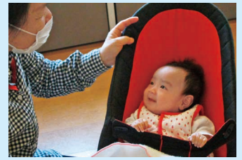
かわいい笑顔に癒されます