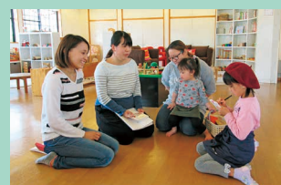
「ご注文は…」お仕事体験