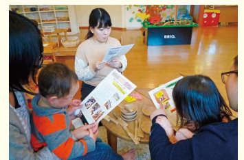
「キラリ」見て思いを共有するお母さんたち