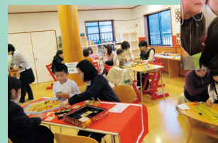
夜のカフェ(16:00~19:00)年間4回開催