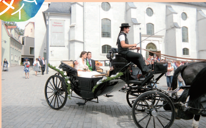
ワイマールの教会で結婚式を挙げたカップルと出会いました!!

3月は卒業、別れの季節です。4月からの新しい、学校、クラス、グループ、職場などに期待と不安でソワソワする季節ですね。「あなたにとって、人生のヤマ場となった出来事は何ですか?」そんなアンケートの集計を目にしました。