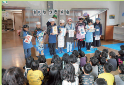
今年のお餅は僕たちが作ったお米です!味付けは…お楽しみ。

4月桜と共に新しい出会いから、早いもので3月。お別れの季節です。あと1か月もすれば、桜も新しい出会いの準備をすることでしょう。今年は、NIKO NIKO 館も20周年を迎えることができました。地域の皆さんの力をお借りして、また要望に応えることで、NIKO NIKO 館の魅力を作り上げてきました。私たちスタッフは、いつの時代も皆さんに子ども達のことをよく観察して下さり、その眼差しの優しさに、感動させられることも度々でした。今年も皆さんの力をお借りし、多様なおつきあいを体験する中で、育ってきた子どもたちの姿、お互いを感じた喜び、感謝、いろいろな人との出会いがひとり一人の力になってきたことを私たちスタッフも「これでよかった」「これからのNIKO NIKO 館に向けて多様な交流を続けよう」再確認することができました。これからの未来に向けて、子ども集団だけでなく、自分の周りにはいろいろな人がいること、そしてお互いに良い刺激を受けながら成長していきたいと思っています。(大堀 純子)