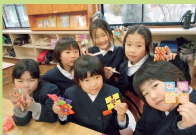
くままちひなまつり作品完成!ぜひ見に来てくださいね。

平成28年度 NIKO NIKO 館のイベントでは、地域の方、ボランティアの方々にご協力頂き、どのイベントも楽しく盛り上がり、皆さんの笑顔がたくさん見ることができました。