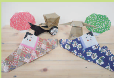
花ひびけ 子も童育和会INくままちひなまつり