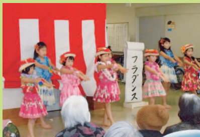
フラダンス披露 (あけぼのにて)