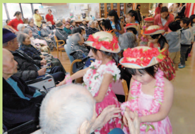
「これからはも元気でいてね☆ありがとう」