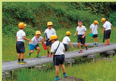
何を見つけたかな？