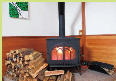
ゆらゆら揺れる炎 薪ストーブ