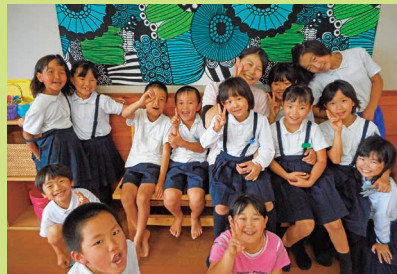
実習生と楽しい思い出 ありがとう