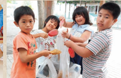
三匹の子ぶた もみを使ってつくろせ！