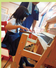
初めての…はちおり機