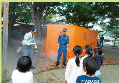
三施設合同避難訓練