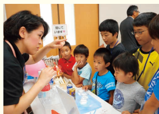
お菓子にはこんなに油が入っているんだね

大きな舞台で緊張するかと思いきや本番前の練習から「もう練習1回する」「私はこの色のレイ（フラの飾り）にする」と準備からやる気満々。披露後は「楽しかった～」と、子どもたち。さて次はどこで発表するでしょう。今から楽しみです！