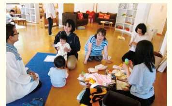
すっかり打ちとけて赤ちゃんグッズの紹介