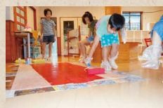
ペンキ職人、久万産の屋根完成！