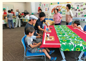
お待ちせしました！