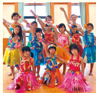
わくわく・ドキドキフラガール披露