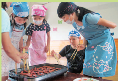
もうすぐ完成！今日のメニューは手巻き寿司。