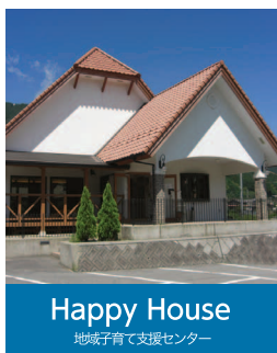
Happy House 地域子育て支援センター

〒791-1201 愛媛県上浮穴郡久万高原町久万1447 TEL:0892-21-0777 FAX:0892-21-0772 hoiku@ikuwa.or.jp