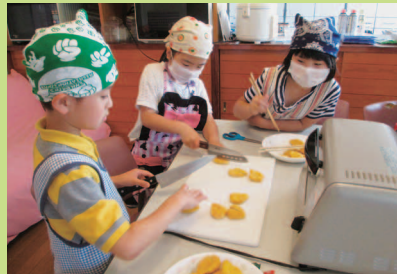
包丁の使い方も上手です。