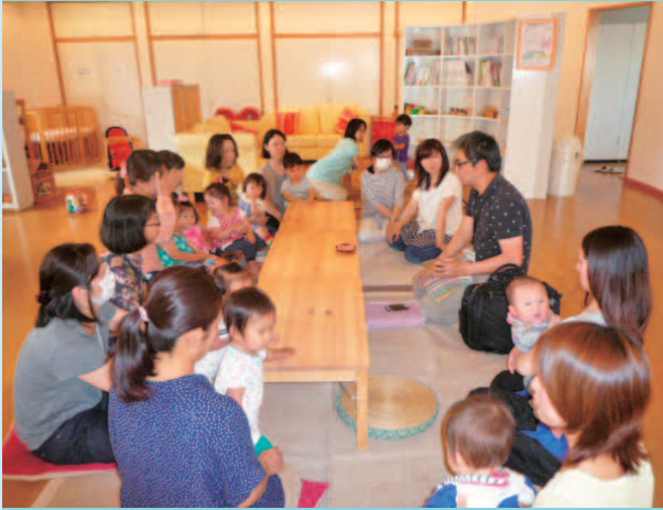
江戸先生の子育てほっとアドバイス