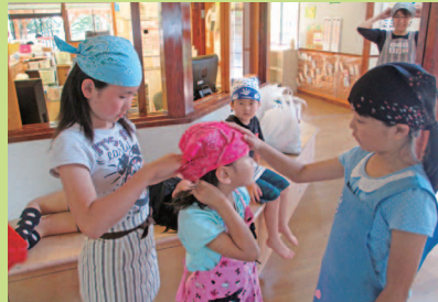
クッキング準備開始。低学年さんを気に掛ける優しい姿。