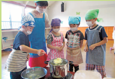
白玉団子の茹で具合は…どうかな？