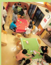
チョビナイト。保護者さんもゲームやカフェ&トークで交流しました。