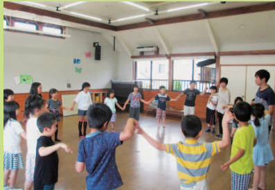
みんなで交流レクリエーション

子どもにとっても、大人にとっても、世代を超えての交流があってこそ、互いに味わいがでるNIKO NIKO クラブでは、今年度初めて、ちよびナイトのイベントを行いました。いつもと違う夜のNIKO NIKO 館を体験したり、保護者の方と交流を深めたり、楽しい時間を過ごしました。グループをつくり、近くのお店に夕食の買い出し、そしてクッキング。高学年さんがしっかりリードする姿は、異年齢での活動ならではの光景です。低学年さんがエプロン・三角巾を着けるのに苦戦していると、スツと後ろに回り、「結んであげるよ」と、優しい手が自然に差し伸べられる姿に、嬉しく思いました。夜は保護者の方とカフェ&おしゃべりタイム。いつの時代も…これからも…いろいろな交流があってこそ、お互いに光っていくのでしょうか。(大堀 純子)