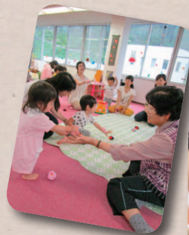
地域ふれあいサロン

6月末に、今年度初めての取り組みとなる地域ふれあいサロンを開催しました。黒藤川地区にあるつづらがわサロンというおばあちゃんグループの方がつどいの広場に遊びに来てくれました。お手玉あそびを教えてくださいましたが、おばあちゃんたちの見事なお手玉さばきに若いお母さんたちからも歓声があがりました。つづらがわサロンの皆さんも「こんな小さい子を見るのは久しぶり!」と交流を喜んで下さり、異世代交流は大盛況でした。次回は8月を予定しています。(村上 裕美)