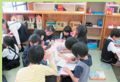
学習タイム。畳のスペースで集中…。