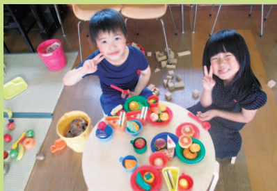
今日のメニューは…。どれも美味しそう。