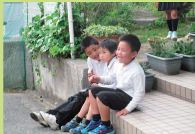
サッカー観戦!みんな頑張れ!