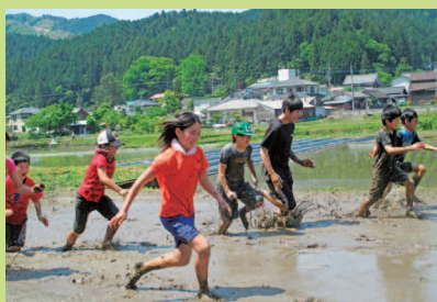
田植え体験。その前に、泥んこ陸上開幕!!!