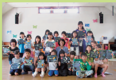
花育キッズ ウェルカムボード作り