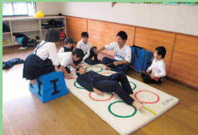
パワーキッズ活動開始！