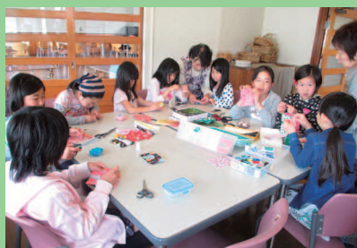
こっとなコットン