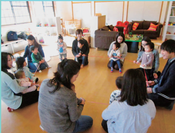
♪ひ～らいた、ひ～らいた