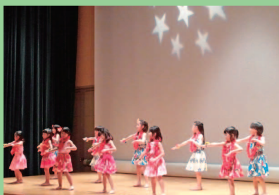
アロハ★フラガールと一緒に踊りましょう。