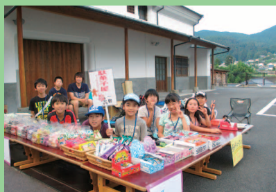
遊友団ボランティア活動一緒にやろう！