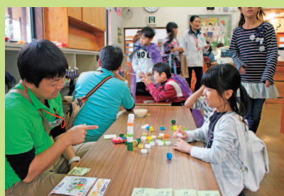
松山市社会福祉事業団より 遊びのアース