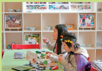
NIKOcafe (地域カフェ) で、まったりと…