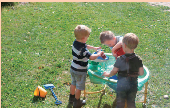
※写真は『保育園で遊ぶ未来の美男子』

スウェーデンの美男子と聞いて、漫画「ベルサイユのバラ」のフェルゼンを思い出すのは、きっと私と同世代の方々でしょう。そう、王妃マリーアントワネットが恋に落ちる相手です。最近、テレビでスウェーデンのハンサム度が取り上げられることも多く、さもありませんといった感じです。長身で手足が長くまさにモデル体型。そしてクールな雰囲気。飛行機で隣り合わせた人、街ですれ違う人、本当に見とれてしまうような人が多いのです。