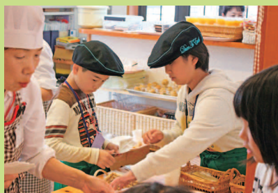
20 周年 ありがとうカレー