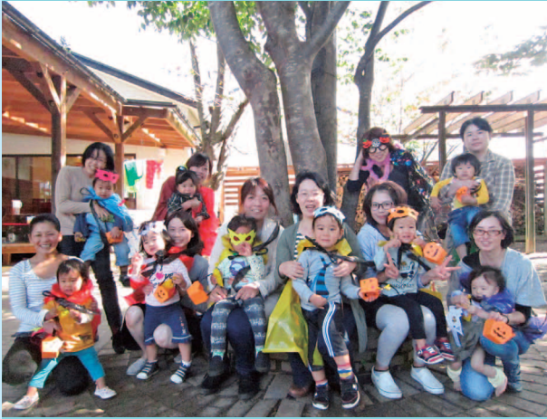
みんなへんしーん!