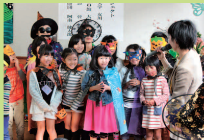
Happy ☆ハロウィンパーティー