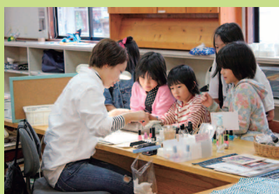
NIKONIKO クラブ卒業生 ネールアート