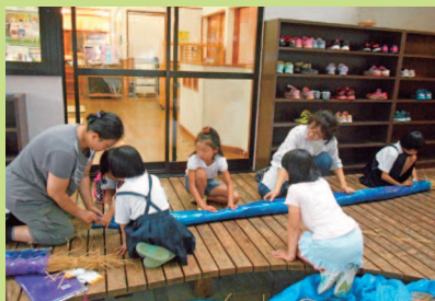
かかし作り。わら縄網みか上手になりました。