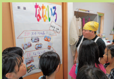
New パステル工房…とても素敵な施設でした。