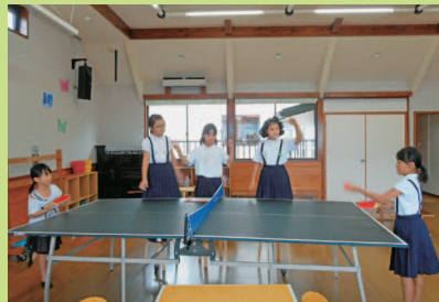
卓球コーナー。東京五輪に向けて…!