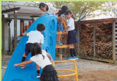
児童健全育成財団より寄贈「ねじりん」

NIKO NIKO 館に卓球台が来ました。今年はリオ五輪で様々なスポーツをテレビで応援したご家庭も多いかと思います。ある時…「卓球台があればいいな」との声。実は、過去に使っていた卓球台があり、再び NIKO NIKO 館の卓球コーナーへ。15分毎の交代制で受付しています。ある時…「次の人が来んけん、ラッキーやった」と時間が過ぎても続けた A 君。しかし数日後、「外で遊びすぎて、卓球の時間が過ぎてしまった」と A 君。やっぱりね…こうなることを予想して声は掛けていました。A 君にとって卓球を通して2つの体験。いつも成功体験だけではありません。失敗することがあってこそ次に繋がることも多し…。けれど、その失敗をプラスに変える会話があるからこそ成り立つのでしょうね。どんな場面でも、自分も相手も考えられる気持ちを大切にしたいものです。(大堀 純子)