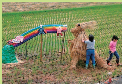
今年のかかしタイトル「NIKO かいじゅうがやってきた!!」