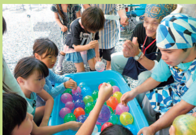
パステルまつりに遊びに行きました!