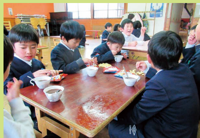
ホットココア 冬は温かいおやつタイムに癒されます