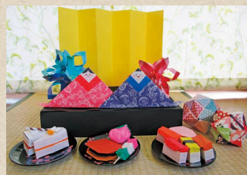
くま山のうれしいお節句