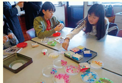
こっぴんコットン

来年度もいろいろな活動を予定していますので、ぜひNIKO NIKO 館で素敵な繋がりを見つけましょう。