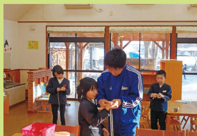
こま回し 巻き方のコツ教えてもらいました