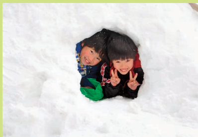
がまくら 完成 入り口はちょっとちいさめに…