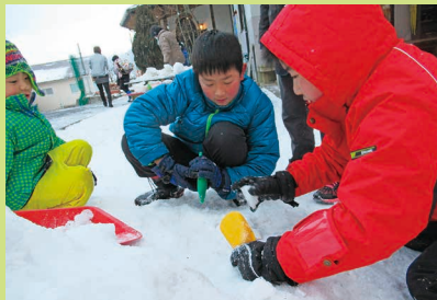
冬のシーズンしかできない実験開始

子ども時代をたっぷりと過ごすこと…それは、人生の中でとても貴重な時間。4月桜と共に新しい出会いから、早いもので3月、お別れの季節です。今年度も、地域のご協力で多様な出会いや経験を行うことで、子どもたちにとって、安心感や自己肯定感へと繋がり、一人ひとりの豊かな心と大きな力になりました。今後もNIKO NIKO 館は、子ども時代をたっぷりと過ごせる居場所、安心できる居場所であるように、これからも子どもたちの未来に繋がるような支援ができるよう、家庭・地域と共に、取り組んで行けたらと願っています。子ども時代の記憶の中に、たっぷりの笑顔と愛情が残るように…。(大堀 純子)