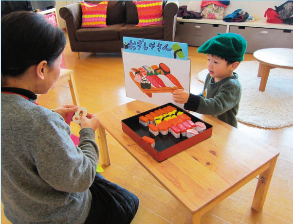
いっしょにしゃいませ〜