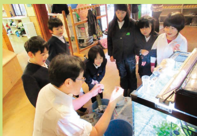
水槽のお掃除を見学しながら…これ何?あれは?質問タイム