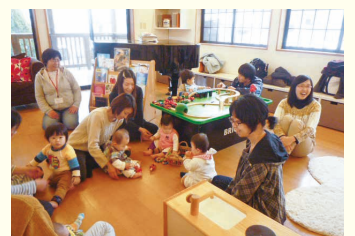
終了後も親子でゆつたりと過ごして