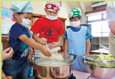
まぁ…そうめんは、1分半が勝負！

夜は、保護者の方と交流会。ゲームやおしゃべり、地域カフェなど楽しい時間を過ごしました。いろいろな世代が集まる場所にこそ、未来への一歩が見られるのかもしれないね。素敵な時間を過ごしました…。 (大堀 純子)