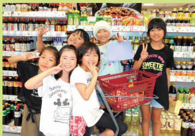
みんなでお買い物