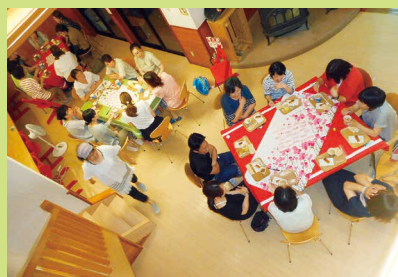
夜のカフェでまったりおしゃべり