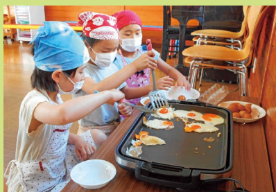
目玉焼きはまかせてね！