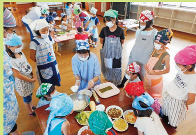
みんな“おにぎらず”ができるかな？